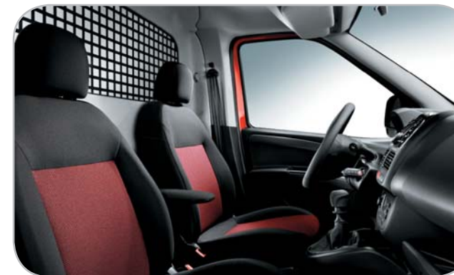
TESSUTO ROSSO 110