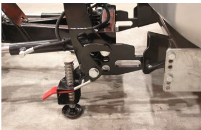
Attacco rapido: sollevare la maniglia del pattino per collegare lo spazzaneve al veicolo.