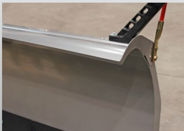
Deflettore per neve opzionale in acciaio (lama retta)