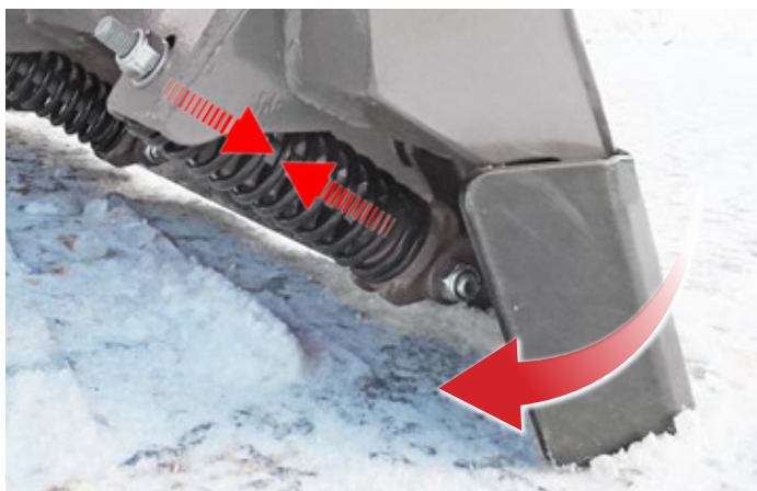
Bordo di taglio con molle per ostacoli